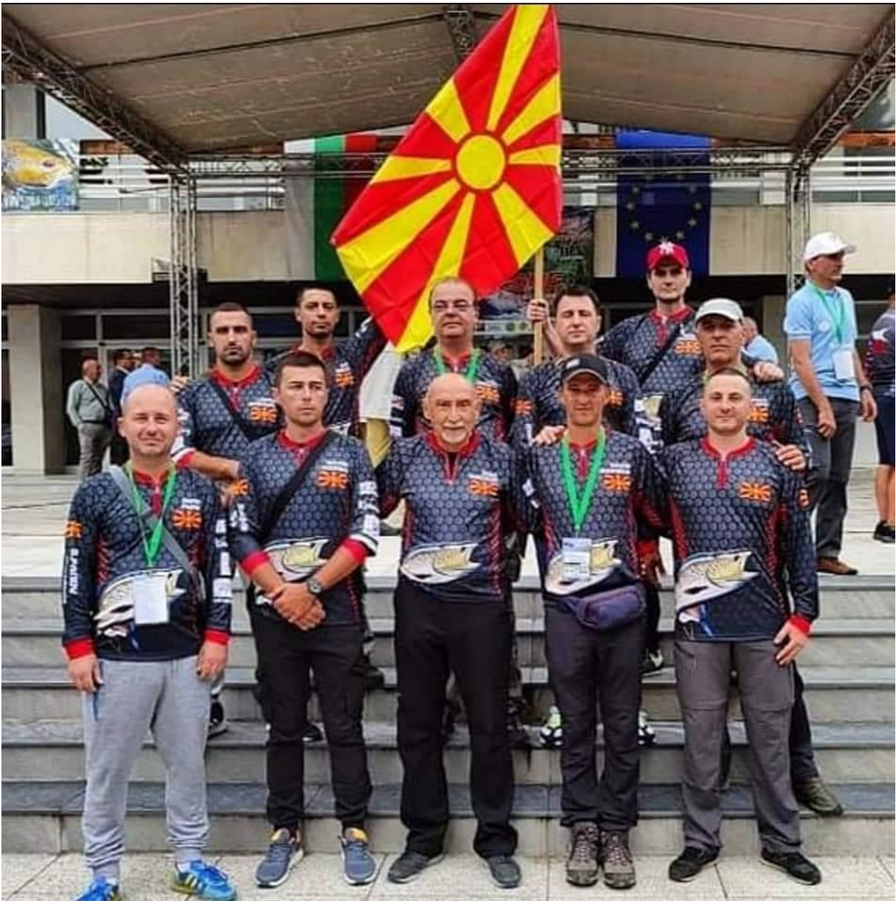
Репрезентација дисциплина Спин - Бугарија