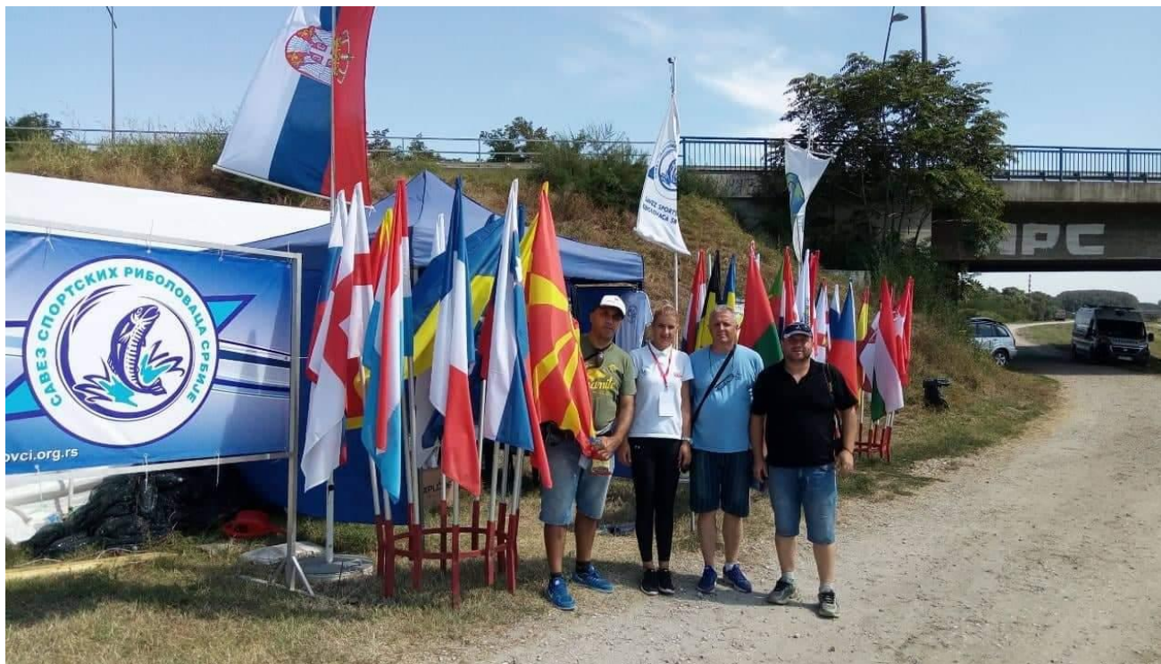
Репрезентација дисциплина Пливка

66 - то Светското првенство во риболов со јадица на пливка за нации кое се одржа од 04.09 до 08.09 2019 година во Нови Сад – Србија.