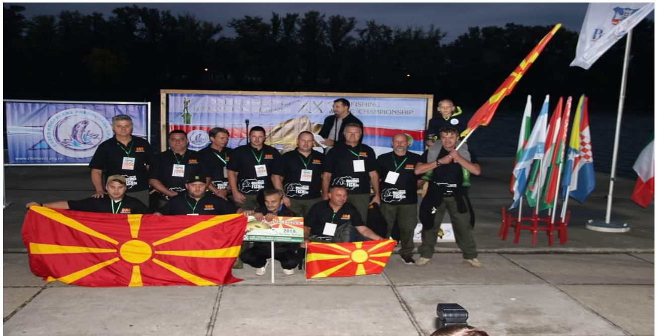
Репрезентација за дисциплина „Крап“

20 - то Светското првенство во дисциплина „Крап“ што се одржа во период од 03.10.2018 година до 06.10.2018 година на Ада Циганлија - Сава, Србија.