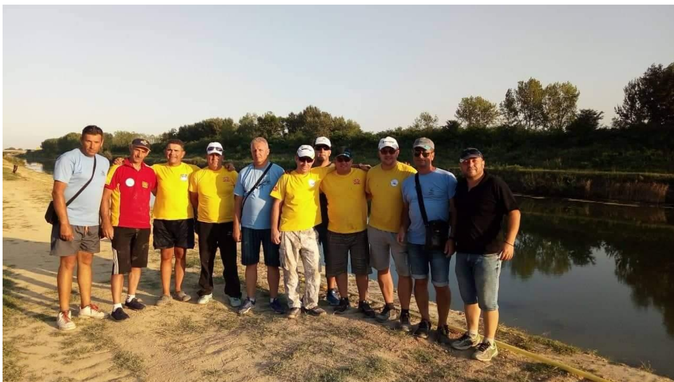
Репрезентација дисциплина Пливка